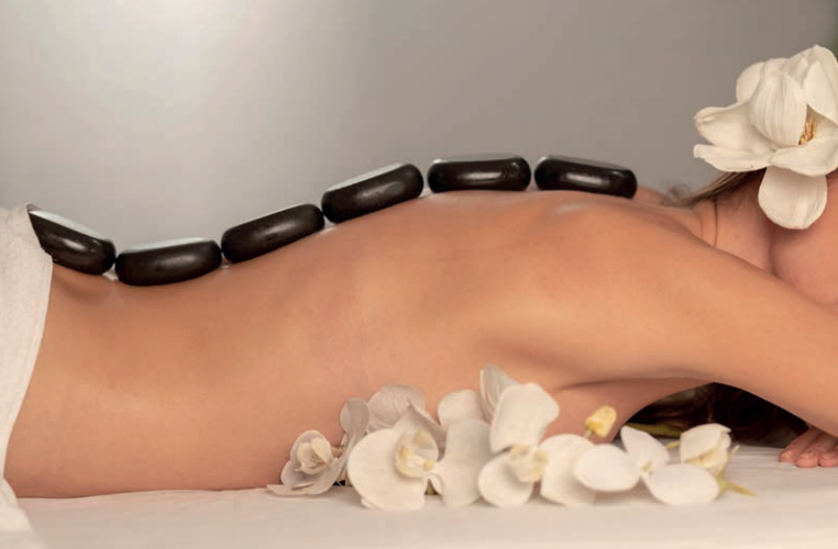
Wellness mit einer Hot Stone Massage