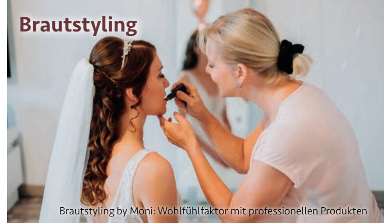
Brautstyling by Moni: Wohlfühlfaktor mit professionellen Produkten